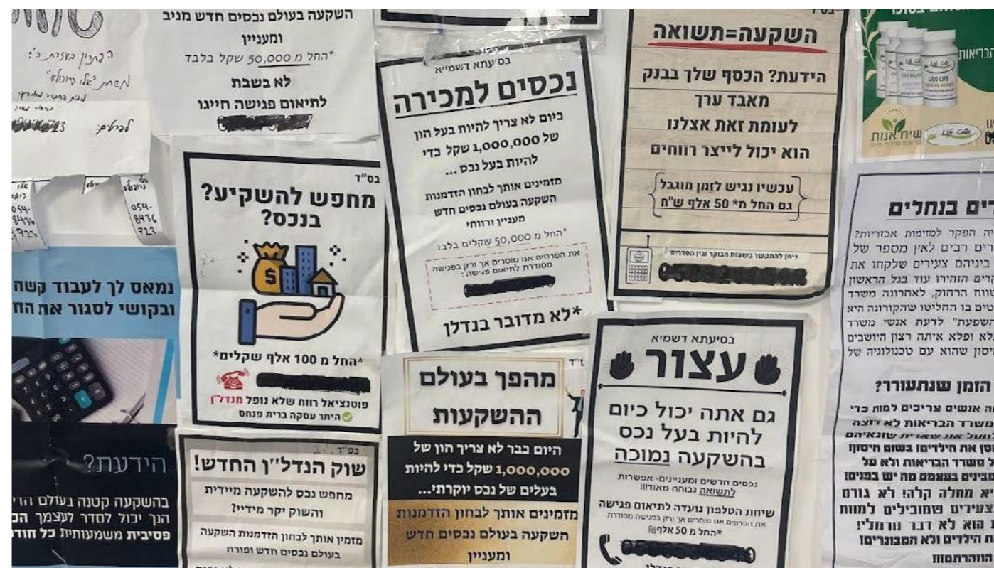
מקבץ מודעות לדוגמא שהתפרסמו באזורים החרדיים.